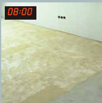
08:00 8點 進場，拆除舊有飾面