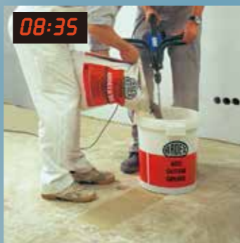
08:35 8點35分 將ARDEX K55超快乾 鎖水自平泥澆置於地面