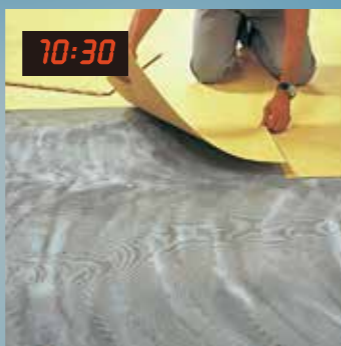
10:30 10點30分 逐步鋪貼彈性地材