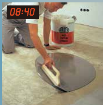
08:40 8點40分 利用鏟板迅速整平基面