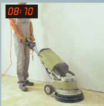
08:10 8點10分 磨除殘膠