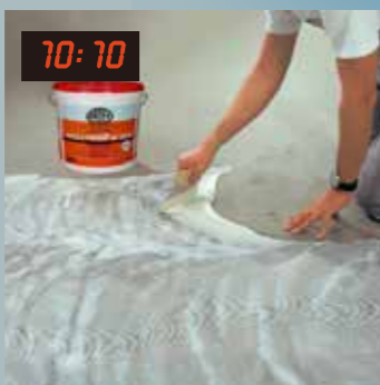
10:10 10點10分 開始刮膠鋪貼彈性地材